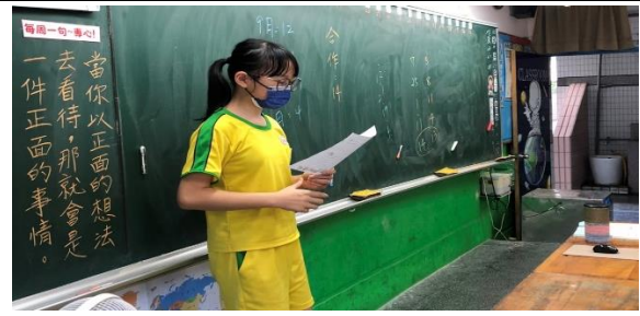
教師指導愛家課程、說說自己的姓名、教材影片及學習單內容、學生分享自己的學習單