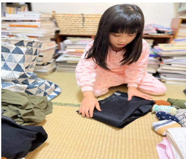
◆ 照片說明：我會進行大小長短衣物的分類工作