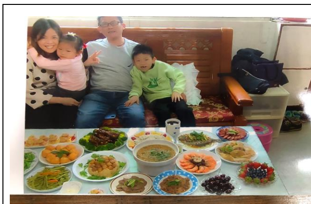
◆ 照片說明：和家人一起準備年夜飯