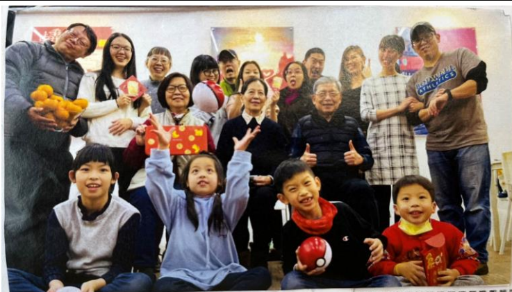
◆ 照片說明：向親友拜年，說吉祥話