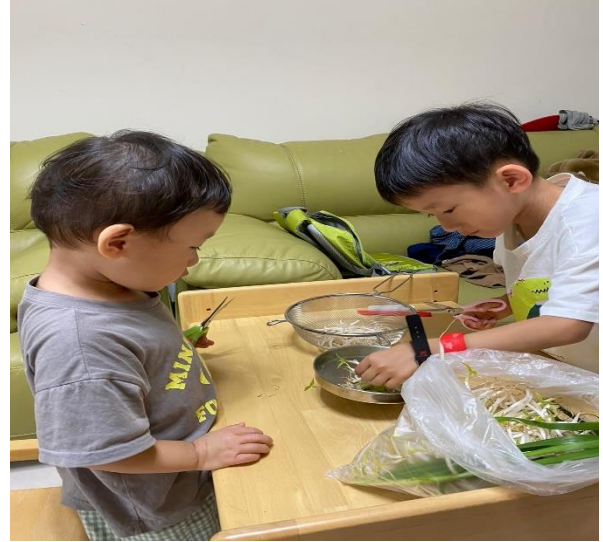
◆ 照片說明：我會自己挑菜、清潔蔬果了！