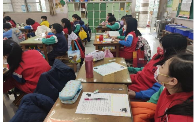
綜合課透過 ppt 一起閱讀繪本【媽媽的紅沙發】並書寫學習單