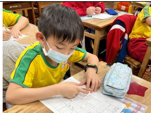
◆ 照片說明：練習寫卡片送給媽媽