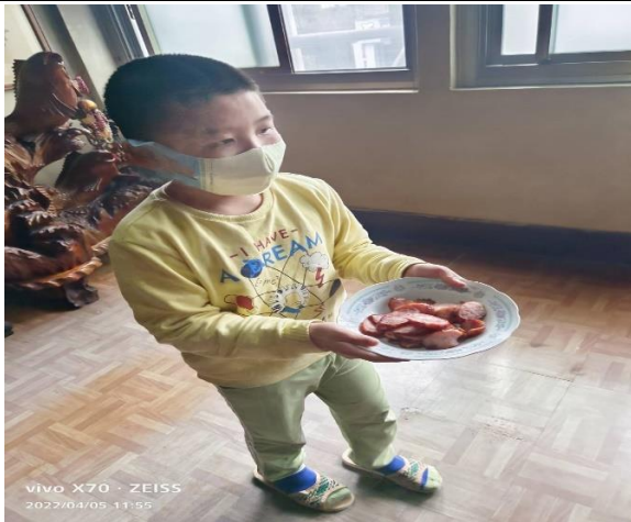
◆ 照片說明：與家人準備竟神明或祭祖的牲禮