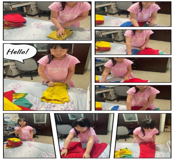
◆ 照片說明：與家人一起摺衣服，學會各種衣物的唸法。