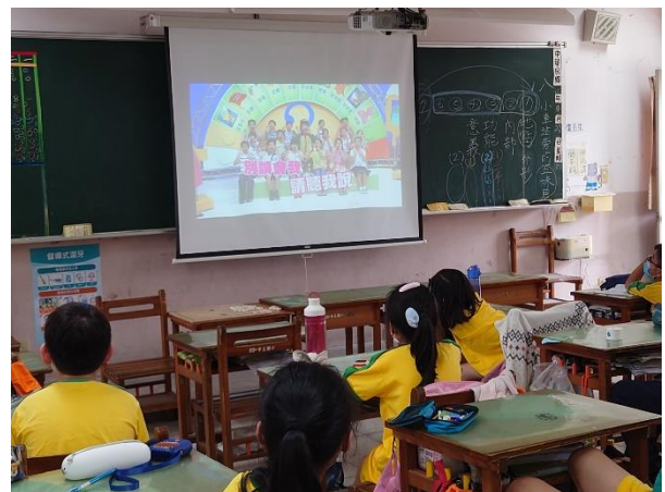
觀看「當我們童在一起」節目-「我懂你的心情」學習了解情緒與控制情緒