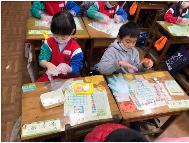
◆ 照片說明：冬至搓湯圓活動