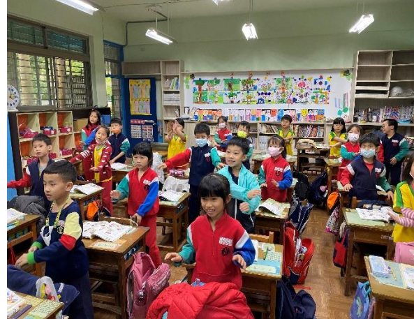
◆ 照片說明：學唱歌曲〈美麗的康乃馨〉，感謝辛勞的媽媽！