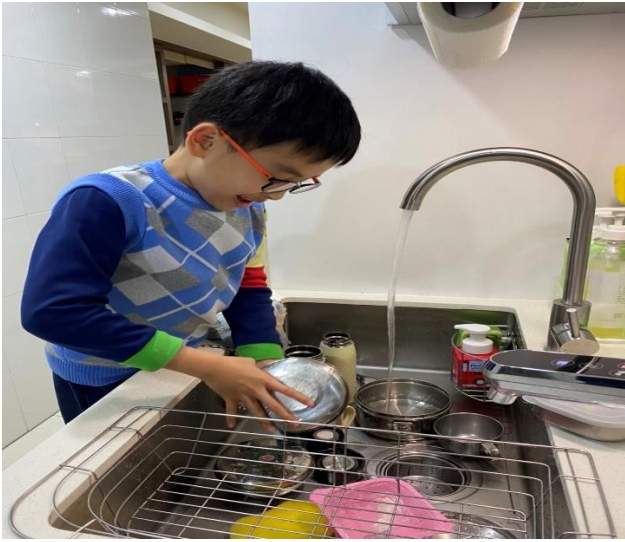
◆ 照片說明：我長大了，會自己洗碗盤！