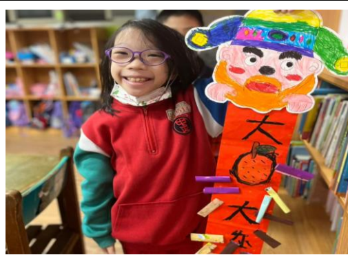
◆ 照片說明：製作春聯布置家裡。