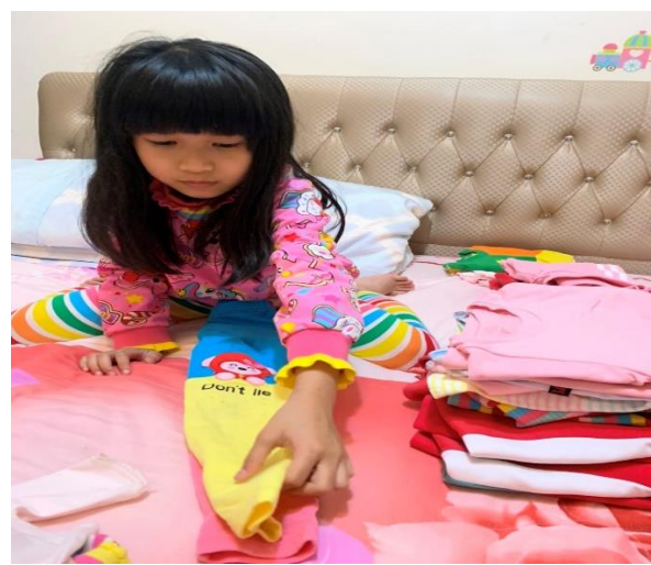
◆ 照片說明：學會進行家中長短袖衣褲的分類與統計