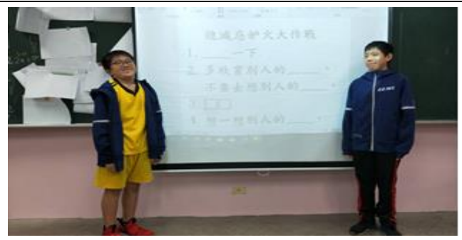
以當我們童在一起節目「相親相愛感情好」引導學生多欣賞他人優點，更能凝聚友誼。