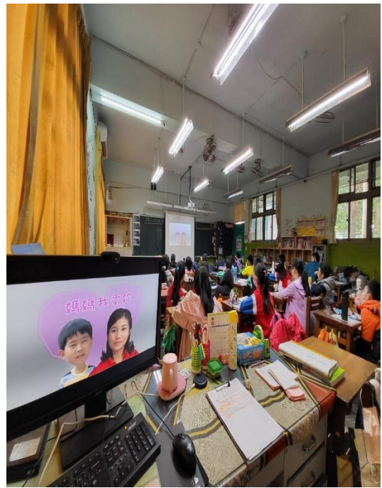
教師分享在家中的曾發生的衝突、觀看我愛我的家影片、學習單成果