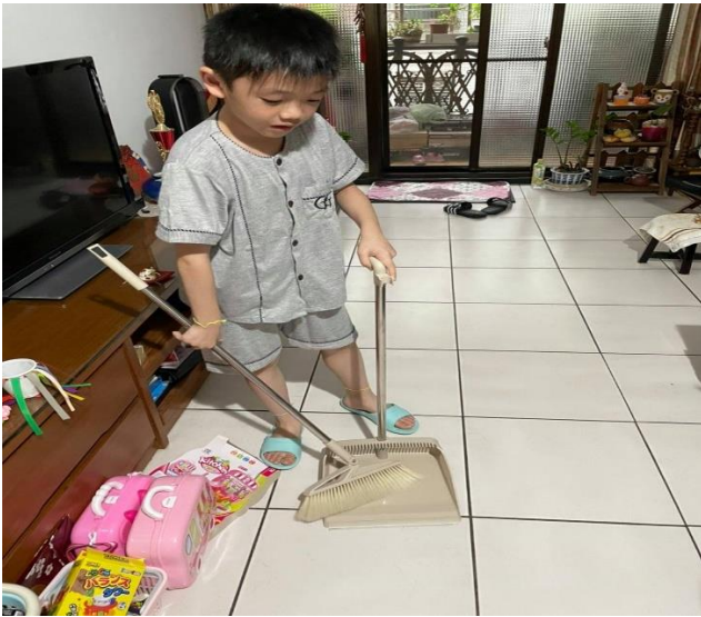
◆ 照片說明：了解各種打掃工具的使用方法，養成勤打掃，愛乾淨的好習慣。