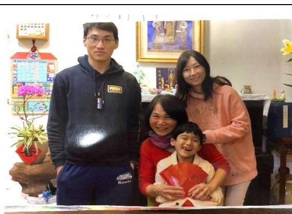
◆ 照片說明：和爸媽討論規劃壓歲錢用途