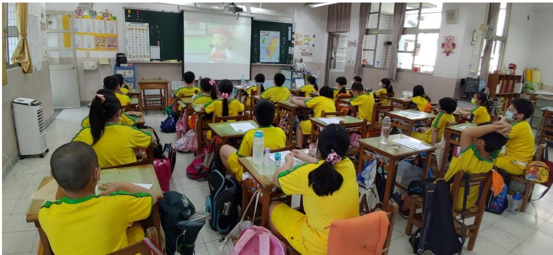
綜合課觀看【唐朝小票子】-愛的飯糰影片並書寫學習單