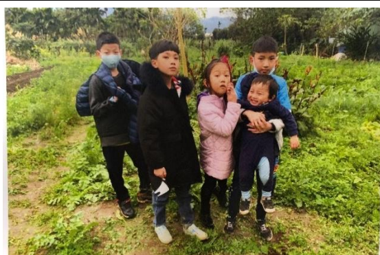
◆ 照片說明：和家人走進大自然、體驗農耕樂