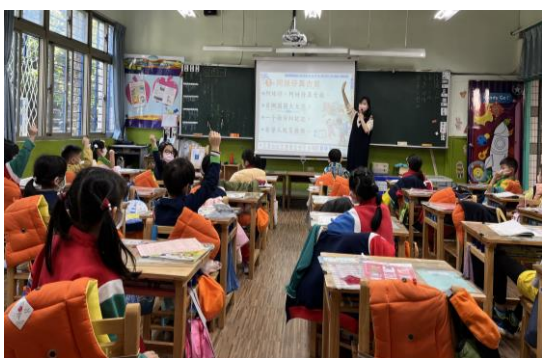
◆ 照片說明：認識家人的多元角色