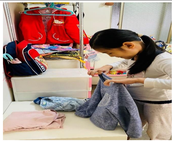
◆ 照片說明：歲末和家人整理舊衣