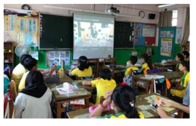
觀看影片、學生寫下對於家的聯想並分享、學習單成果