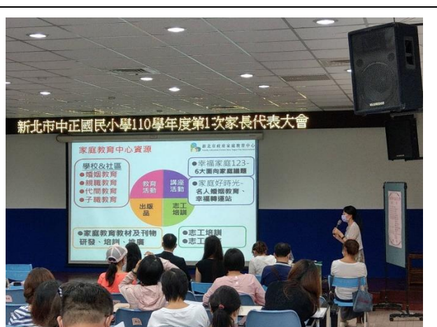
介紹家庭教育中心資源