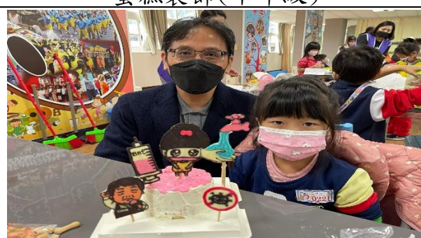
校長與學生及成品合照