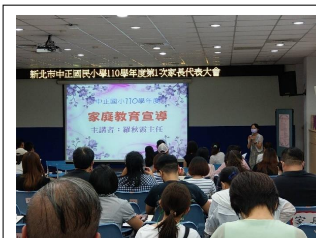
由輔導主任進行宣導

4. 活動內容:家長代表大會選舉委員等待計票結果時間，由本校輔導主任進行家庭教育宣導，除了介紹本校可由本校網頁獲取學校相關訊息，並且可以連結新北市政府家庭教育中心網頁，瞭解中心提供的服務。此外，亦說明本校本學期將進行的一些家庭教育相關活動，請代表將相關資料轉知各班家長，踴躍報名參加學校活動。