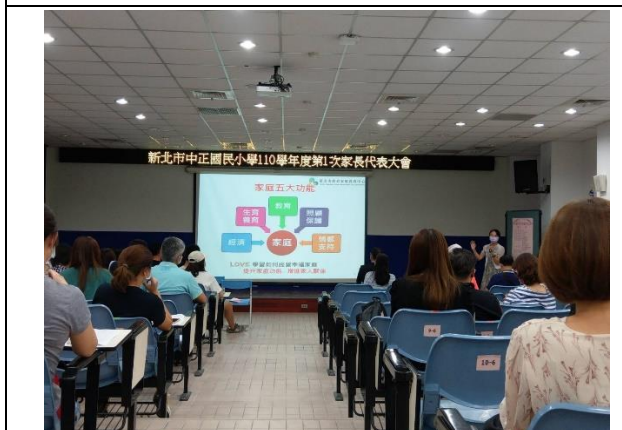
說明家庭教育功能