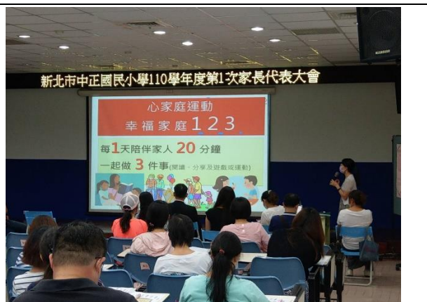
請家長在家可以進行「心家庭運動」