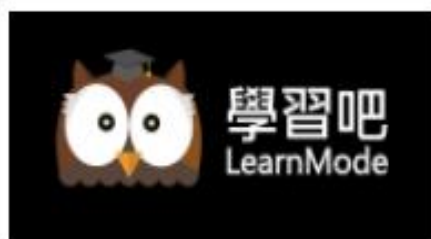
學習吧 - 新北特製版