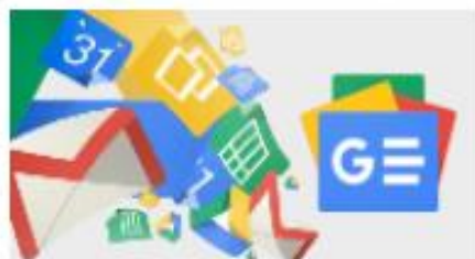
谷歌雲端應用服務入口