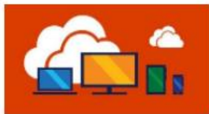
微軟雲端應用服務入口