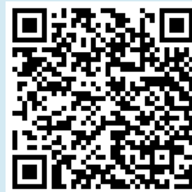
戲劇班課程行事曆