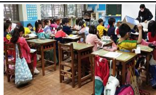
說明：老師指導完成「明天天氣會怎樣」學習單