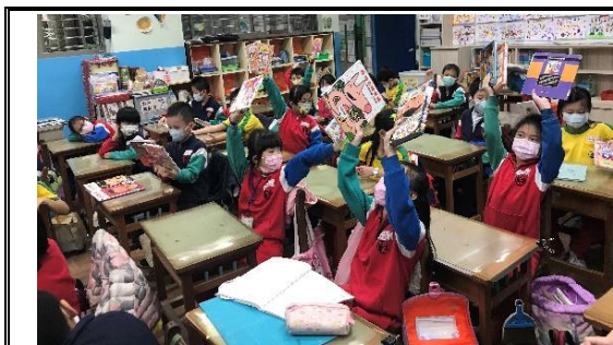
說明：老師利用巡迴書箱、愛的書庫來推廣閱讀，讓孩子覺得收到書就像拿到禮物般快樂。