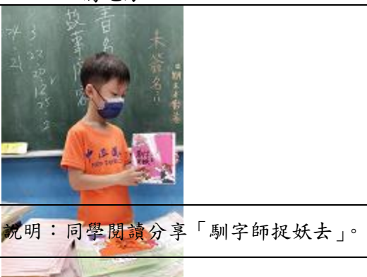
說明：同學閱讀分享「馴字師捉妖去」。