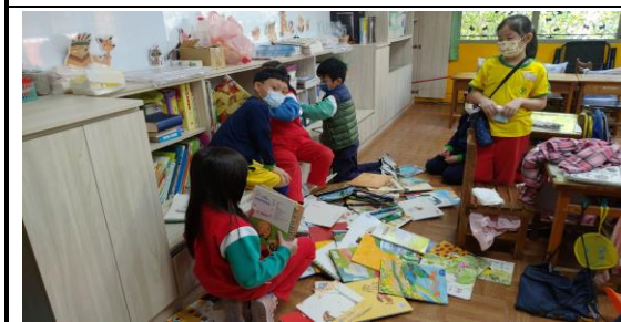
說明：閱讀區的整理，這也很重要喔！