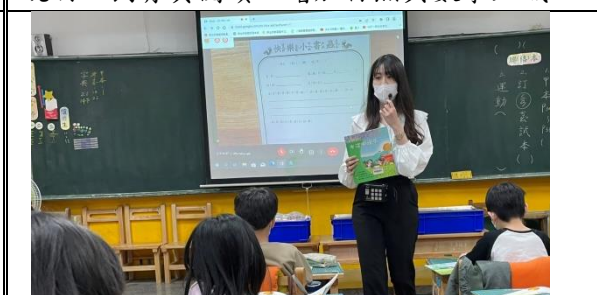
說明：由老師導讀（米從哪裡來），全班再根據主題加以討論並引導學習單。