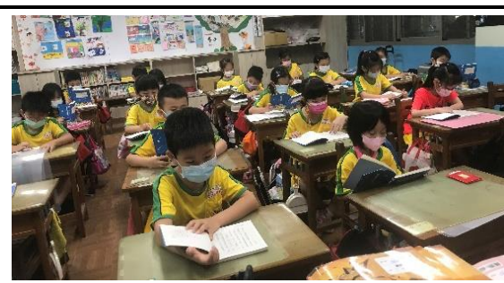
說明：在晨光時間、課堂上時各自閱讀與師生討論。小朋友對於故事內容充滿興趣、沉浸書箱之中。