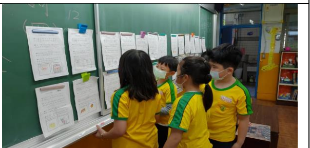
說明：作品欣賞，同儕學習的一環