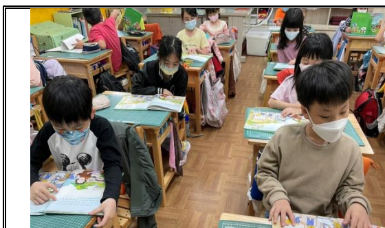
說明：晨光時間寧靜閱讀（米從哪裡來）