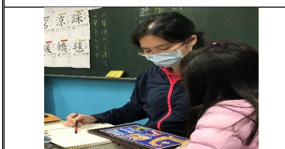
說明：師生進行書的各別問答互動與閱讀本的批改。老師用鼓勵有趣的方式提升孩子的閱讀興趣。