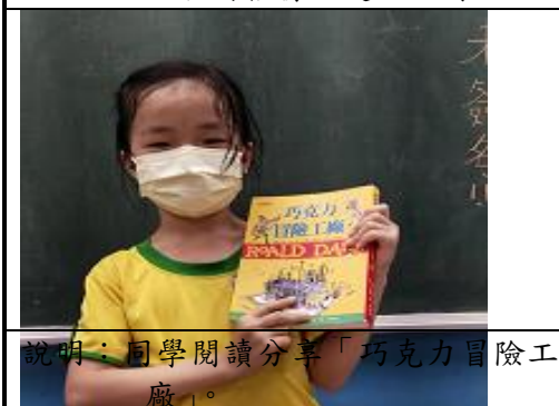
說明：同學閱讀分享「巧克力冒險工廠」。