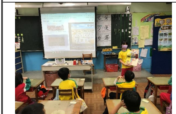
說明：利用多元期刊，小朋友在認字不多的情況下也可以朗讀給同學聽。老師找出圖片輔助說明故事內容。