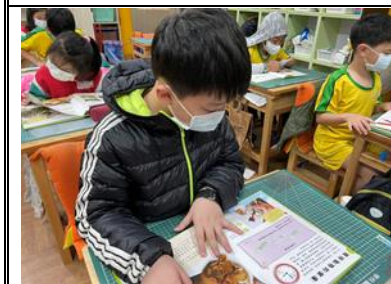
說明：閱讀後口說分享並完成動物園學習單