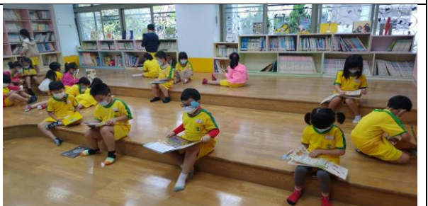
說明：寧靜的閱讀時光。