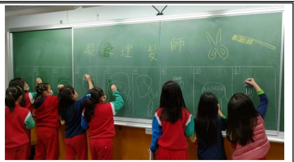
說明：閱讀中的塗鴉遊戲。