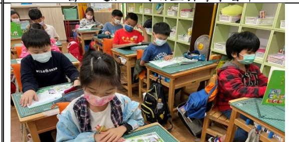
說明：全班共讀（米從哪裡來）並討論。