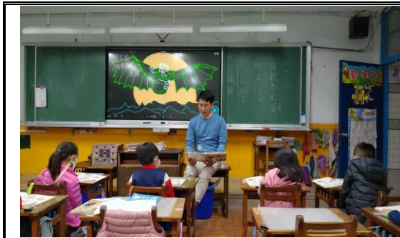
說明：晨光共讀前的導讀。