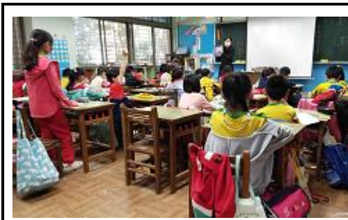
說明：老師導讀「明天天氣會怎樣」，全班再根據主題加以討論