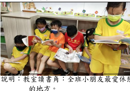
說明：教室讀書角：全班小朋友最愛休憩的地方。