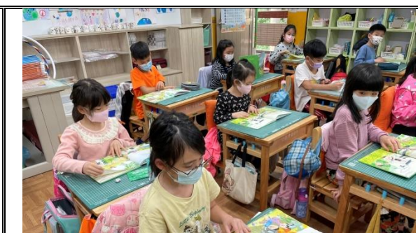
說明：飼育員閱讀，增加自然與數學知識。