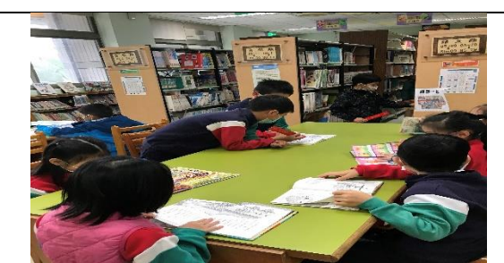
說明：利用圖書館進行圖書館教育，提升小朋友到圖書館借書的興趣與動機。