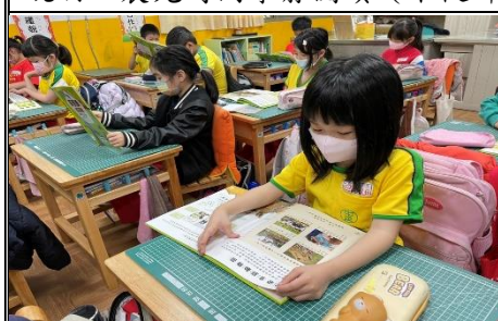
說明：利用早修共讀-飼育員日記。