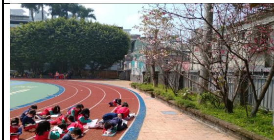
說明：誰說大自然不能閱讀？