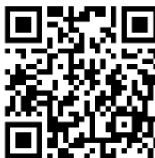
教師報名 QR code